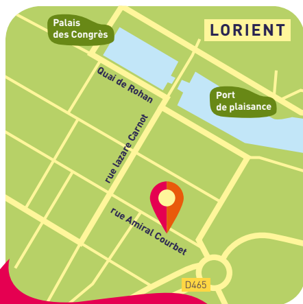
Espace Courbet (Agora) Conférence & festival