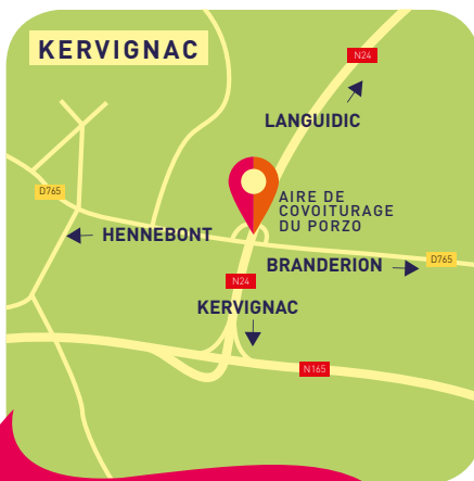
Point de rdv pour les visites vers le Centre de stockage de Kermat