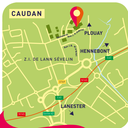
Centre de tri des emballages Adaoz